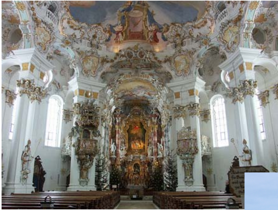
Principios do XVIII