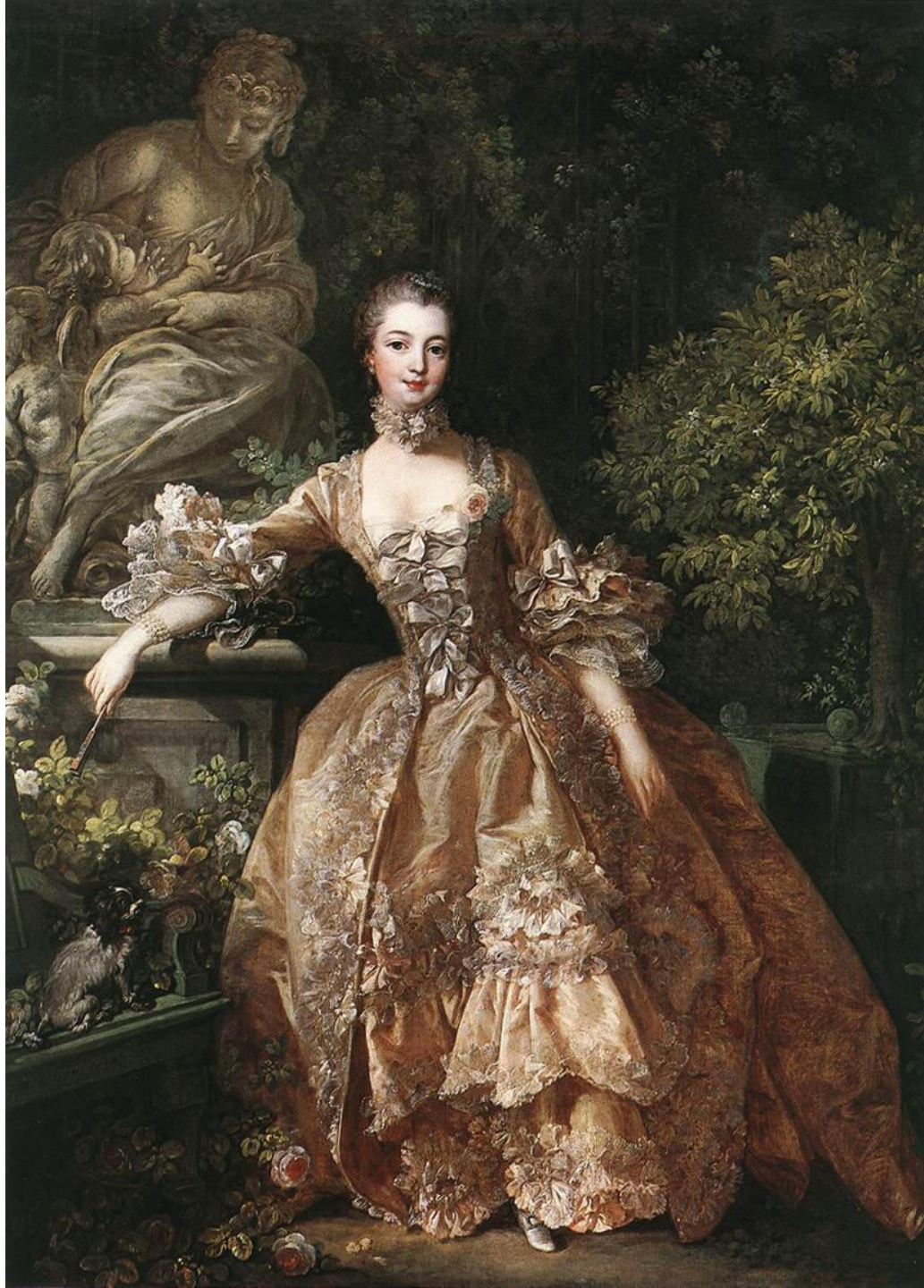
Madamme Pompadour de Boucher