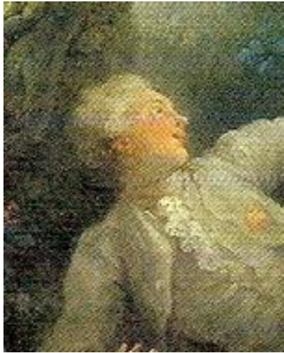
O Bambán de Fragonard