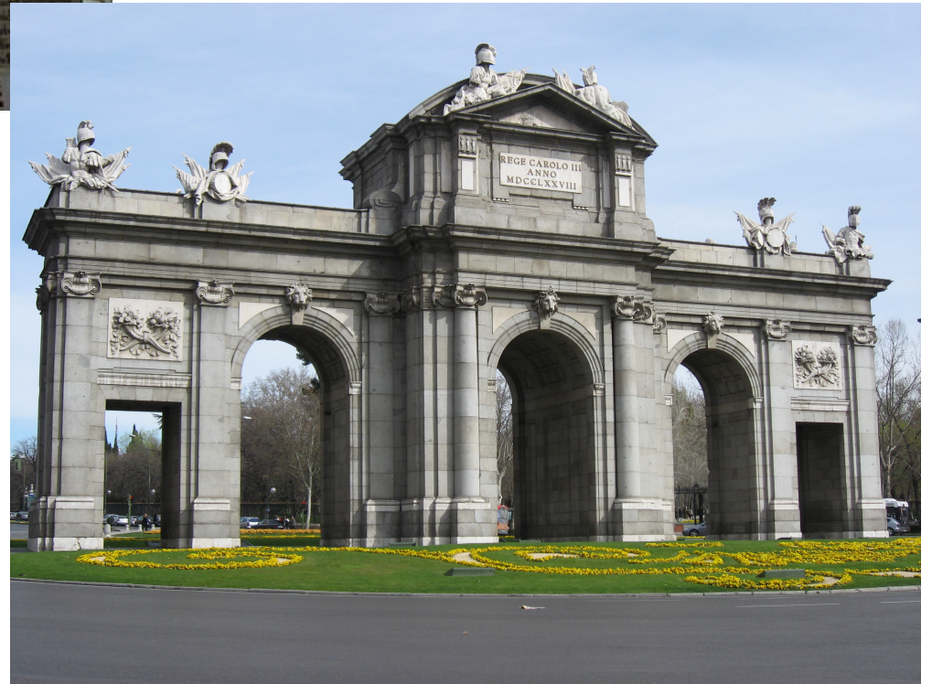
Finais do XVIII