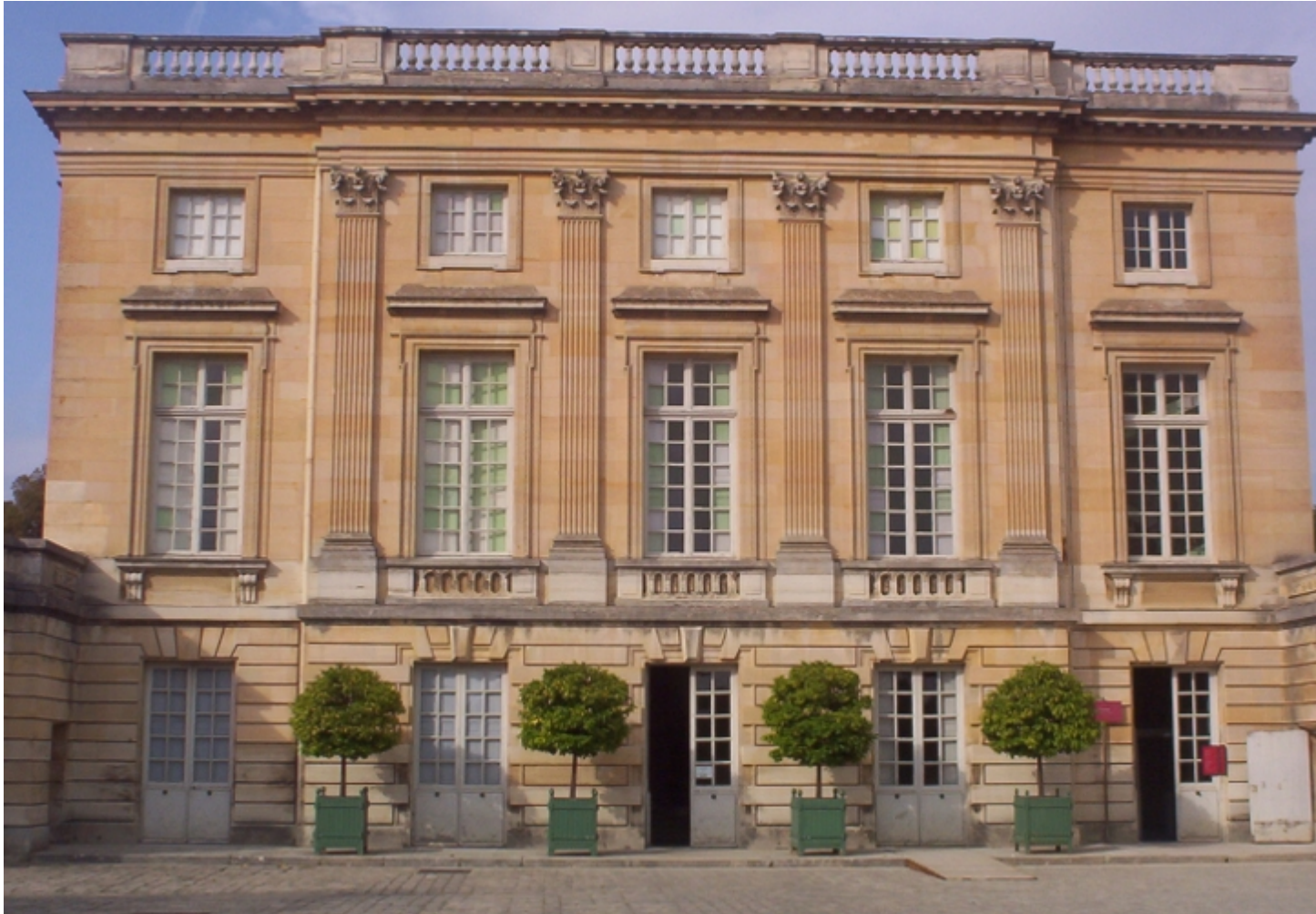
Le petit Trianon