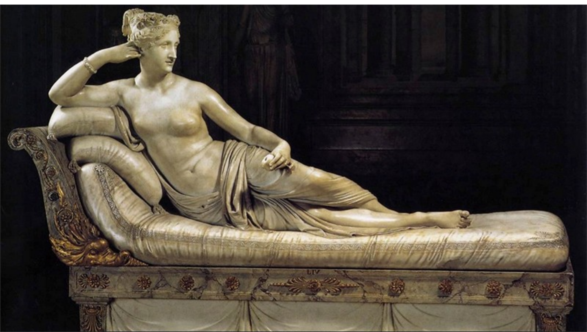
Paulina Bonaparte de Cánova